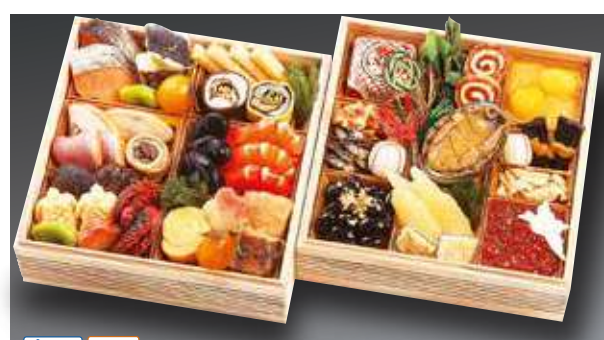
119 214-0119 【伏見・魚三楼】 和風二段…(本体価格15,000円)税込 16,200円 サイズ(18.5×18.5×高さ5.3cm×二段)