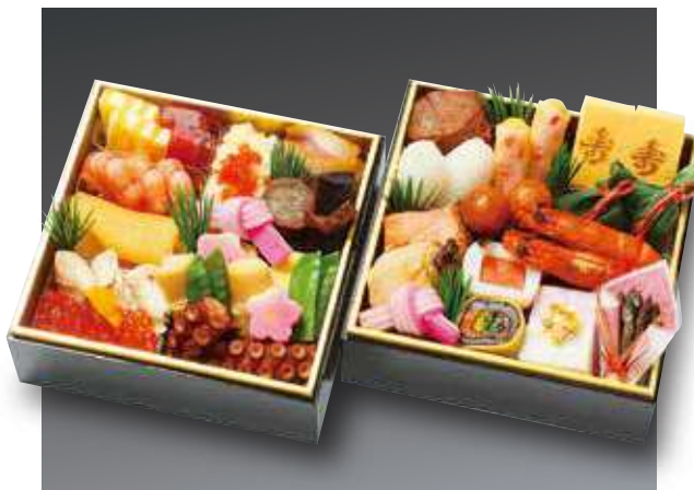
F TEL ネット 159 214-0159 【京都・わらびの里】 送料込 冷凍 冷凍おせち和風二段…(本体価格11,000円)税込 11,880円 サイズ(15.0×15.0×高さ5.1cm×二段)※解凍してお召し上がりください。 お届け日:12月30日