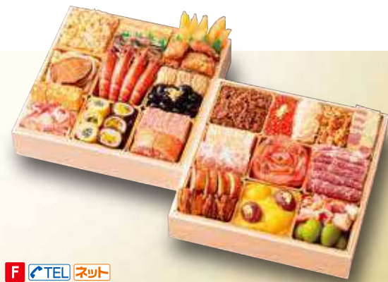
F TEL ネット 90 214-0090 【ウェスティン都ホテル京都】 和洋二段…(本体価格27,500円)税込 29,700円 サイズ(25.0×25.0×高さ5.5cm×二段)