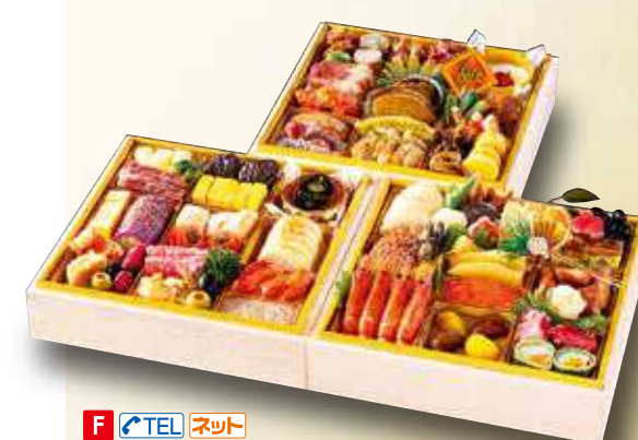
F TEL ネット 88 214-0088 【ANAクラウンプラザホテル広島】 和洋中三段…(本体価格34,259円)税込 37,000円 サイズ(22.5×22.5×高さ5.3cm×三段)