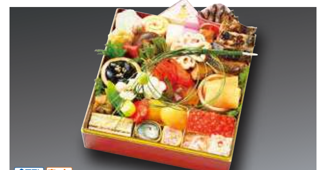
118 214-0118 【木屋町三条・京料理 藤や】 和風一段…(本体価格18,000円)税込 19,440円 サイズ(19.5×19.5×高さ5.8cm×一段)