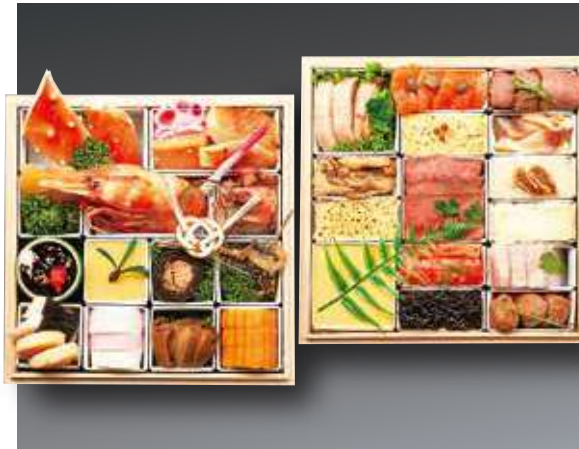
F TEL ネット 157 214-0157 【北海道・ホテル ニドム】 送料込 北海道 海と大地の恵 和洋二段 …(本体価格29,629円)税込 32,000円 サイズ(20.4×20.4×高さ5.5cm×二段)