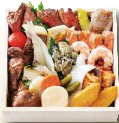
TEL ネット 107 214-0107 【大阪・エプバンタイユ】 洋風(フレンチ)一段…(本体価格20,000円)税込 21,600円 サイズ(20.2×20.2×高さ5.0cm×一段)