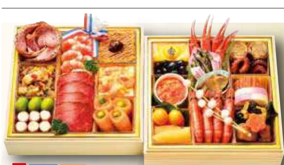
F TEL ネット 113 214-0113 【キャピタル東洋亭本店】 京乃百年洋食 和洋二段…(本体価格21,500円) 税込 23,220円 サイズ(22.7×22.7×高さ5.2cm×二段)