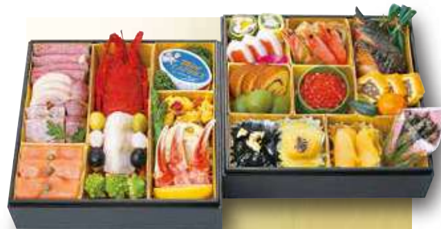
F TEL ネット 92 214-0092 【呉阪急ホテル】 和洋二段…(本体価格20,000円)税込 21,600円 サイズ(22.3×22.3×高さ4.9cm×二段)