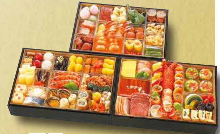
F TEL ネット 83 214-0083 【大阪・リーガロイヤルホテル】 和洋中三段…(本体価格60,000円)税込 64,800円 サイズ(20.5×29.7×高さ6.5cm×三段)