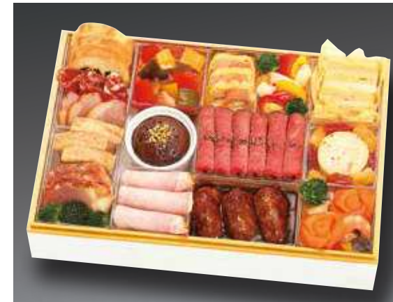
F TEL ネット 送料込 151 214-0151 【京都・マノワール】 洋風一段…(本体価格12,000円)税込 12,960円 サイズ(20.0×29.4×高さ5.4cm×一段)