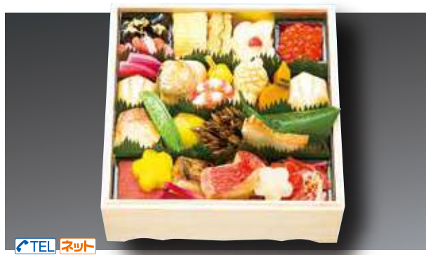
124 214-0124 【清水五条・はり清】 吉祥来福お節 和風一段…(本体価格14,600円)税込 15,768円 サイズ(18.3×18.3×高さ5.0cm×一段)