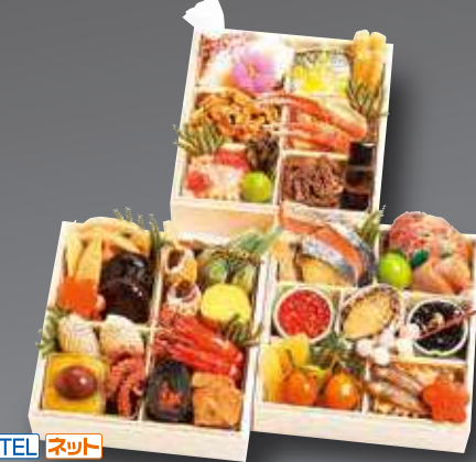
F TEL ネット 送料込 154 214-0154 【京都・三千院の里】 和風ミニ三段…(本体価格12,000円)税込 12,960円 サイズ(15.8×15.8×高さ5.0cm×三段)