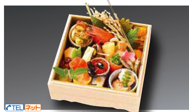
125 214-0125 【宇治・辰巳屋】 和風一段…(本体価格10,000円)税込 10,800円 サイズ(15.5×15.5×高さ7.0cm×一段)