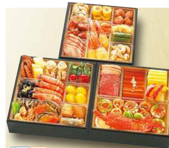
F TEL ネット 84 214-0084 【大阪・リーガロイヤルホテル】 和洋中三段…(本体価格40,000円)税込 43,200円 サイズ(20.6×20.6×高さ6.4cm×三段)