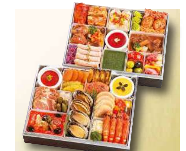
TEL ネット 104 214-0104 【東京・オステリアルッカ】 洋風(イタリアン)二段…(本体価格27,000円)税込 29,160円 サイズ(20.0×26.2×高さ5.4cm×二段)