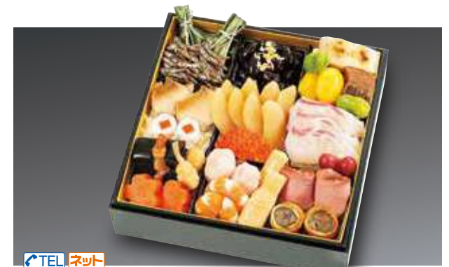
114 214-0114 【岡崎 つる家】 和風一段…(本体価格15,000円)税込 16,200円 サイズ(21.0×21.0×高さ6.0cm×一段)