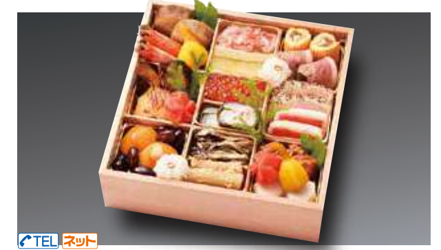
116 214-0116 【祇園二軒茶屋・中村楼】 和風一段…(本体価格18,000円)税込 19,440円 サイズ(20.0×20.0×高さ6.0cm×一段)