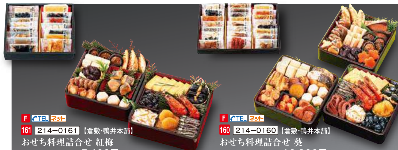
F TEL ネット 161 214-0161 【倉敷・鴨井本舗】 おせち料理詰合せ 紅梅 …(本体価格5,000円)税込 5,400円 お届け状態サイズ(27.0×32.0×高さ7.5cm) ※重箱、飾り物はありません。 個別パックのため盛り付けは御家庭でお願いします。