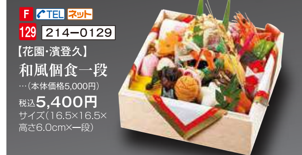
129 214-0129 【花園・濱登久】 和風個食一段…(本体価格5,000円)税込 5,400円 サイズ(16.5×16.5×高さ6.0cm×一段)