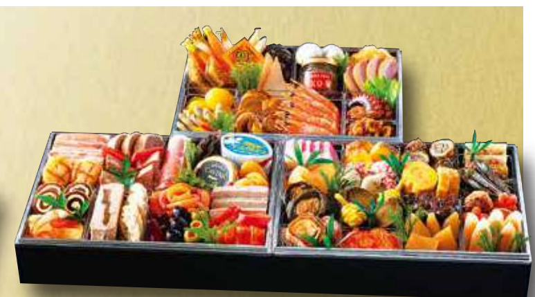
F TEL ネット 87 214-0087 【ANAクラウンプラザホテル広島】 特撰和洋中三段…(本体価格51,851円)税込 56,000円 サイズ(20.0×27.0×高さ5.3cm×三段)