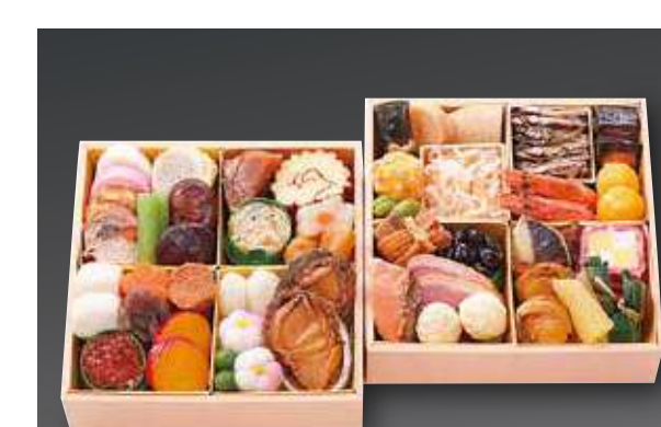
TEL ネット 47 214-0047 【京都・岡庄】 和風二段…(本体価格15,000円)税込 16,200円 サイズ(19.5×19.5×高さ5.2cm×二段)

京都 矢尾卯 やおう 京都から大阪へ向かう西国街道沿い、乙訓の地で暖簾を掲げて百五十有余年の老舗料理屋より彩華やかなおせちをお届けします。