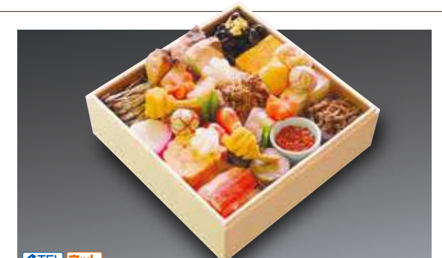
120 214-0120 【貴船・右源太】 和風一段…(本体価格15,000円)税込 16,200円 サイズ(19.4×19.4×高さ5.5cm×一段)