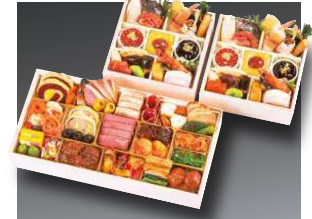
F TEL ネット 送料込 150 214-0150 【京都・三千院の里&マノワール】 和風個食おせちと洋風オードブル …(本体価格15,000円)税込 16,200円 サイズ(15.9×15.9×高さ5.7cm×二折 オードブル:15.9×31.9×5.7cm)