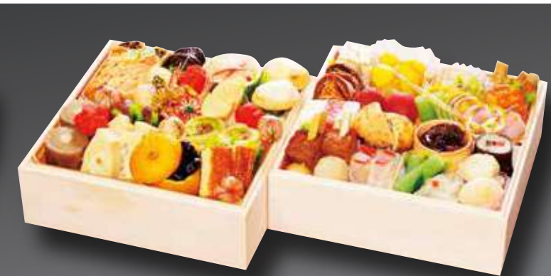
F TEL ネット 37 214-0037 【京都・泉仙】 精進おせち二段…(本体価格28,000円)税込 30,240円 サイズ(21.2×21.2×高さ6.6cm×二段)

京都 泉仙 いづせん 京野菜を中心に厳選素材の持ち味を伝承の技で生かした彩りのおせちです。