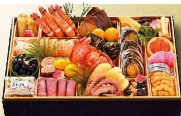
初登場 F TEL ネット 93 214-0093 【福山・鞆の浦 汀邸 遠音近音】 和風一段…(本体価格23,148円) 税込 25,000円 サイズ(23.5×35.0×高さ7.5cm×一段)