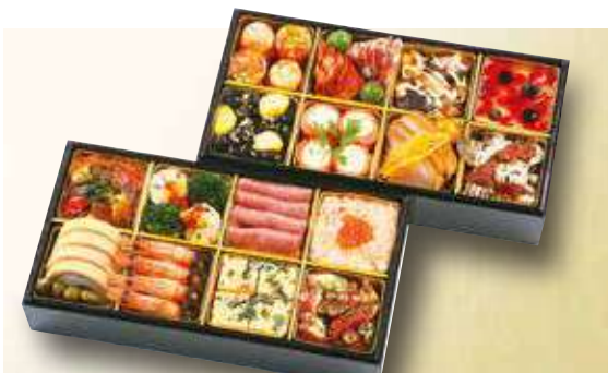
TEL ネット 108 214-0108 【東京・レストラン アルポルト】 洋風(イタリアン)二段…(本体価格25,000円)税込 27,000円 サイズ(14.7×28.3×高さ5.4cm×二段)