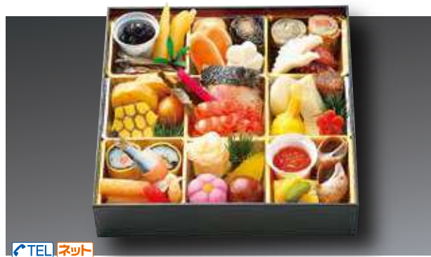
123 214-0123 【宇治・光流園 静山荘】 和風一段…(本体価格10,000円)税込 10,800円 サイズ(21.0×21.0×高さ5.0cm×一段)