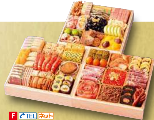
F TEL ネット 89 214-0089 【ウェスティン都ホテル京都】 和洋三段…(本体価格37,000円)税込 39,960円 サイズ(25.0×25.0×高さ5.5cm×三段)