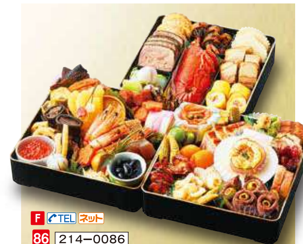
F TEL ネット 86 214-0086 【大阪・ハイアット リージェンシー 大阪】 和洋三段重…(本体価格37,000円)税込 39,960円 サイズ(21.0×21.0×高さ5.5cm×三段)