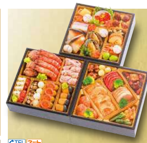
TEL ネット 100 214-0100 【なすび亭／オステリアルッカ／赤坂四川飯店】 和洋中三段…(本体価格27,000円)税込 29,160円 サイズ(18.6×18.6×高さ5.4cm×三段)