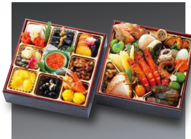
F TEL ネット 158 214-0158 【京都・矢尾卯】 送料込 冷凍 冷凍おせち和風二段…(本体価格15,000円)税込 16,200円 サイズ(19.6×19.6×高さ5.6cm×二段)※解凍してお召し上がりください。 お届け日:12月30日