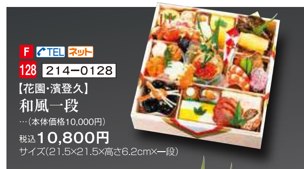
128 214-0128 【花園・濱登久】 和風一段…(本体価格10,000円)税込 10,800円 サイズ(21.5×21.5×高さ6.2cm×一段)