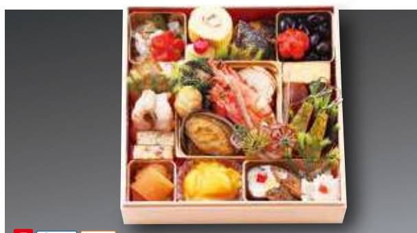
126 214-0126 【大徳寺・泉仙】 迎春重詰一段…(本体価格12,000円)税込 12,960円 サイズ(21.0×21.0×高さ5.2cm×一段)