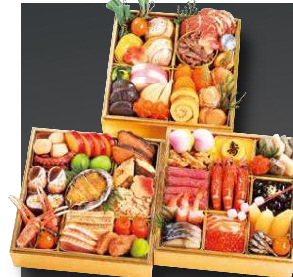
F TEL ネット 送料込 153 214-0153 【京都・三千院の里】 和風三段…(本体価格18,000円)税込 19,440円 サイズ(18.5×18.5×高さ5.4cm×三段)