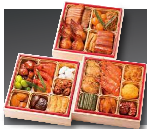
F TEL ネット 156 214-0156 【東京・上野池之端 東天紅】 送料込 中華三段…(本体価格33,000円)税込 35,640円 サイズ(22.5×22.5×高さ5.5cm×三段)