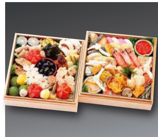
TEL ネット 44 214-0044 【京都・矢尾卯】 和風二段…(本体価格30,000円)税込 32,400円 サイズ(19.3×19.3×高さ5.6cm×二段)

京都 宇治 光流園 静山荘 せいざんそう 平等院のほど近くに店を構える料理旅館。しっかりと味をしみこませながらも素材の色合いを残しました。