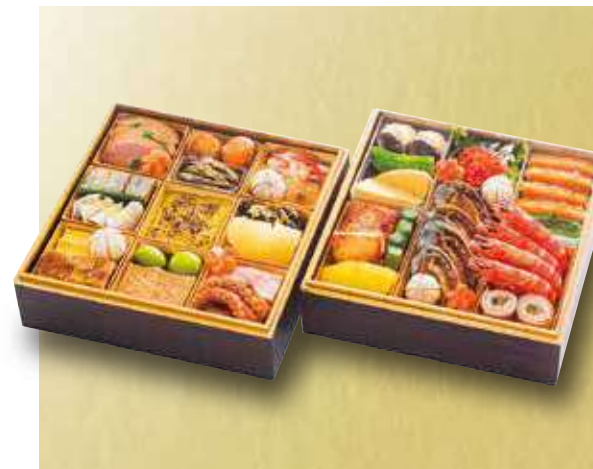
TEL ネット 101 214-0101 【東京・賛否両論】 和風二段…(本体価格25,000円)税込 27,000円 サイズ(20.2×20.2×高さ5.4cm×二段)