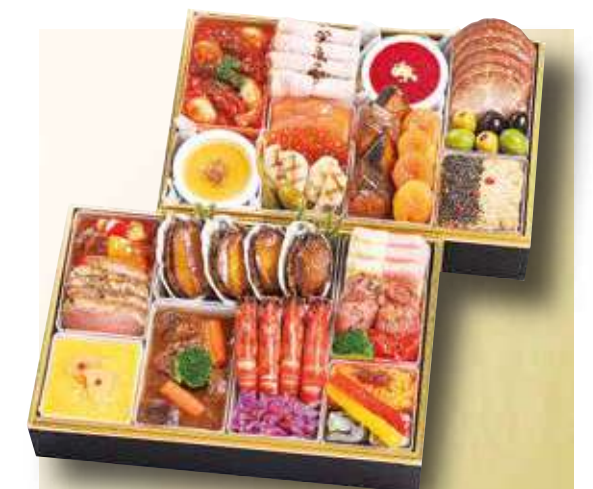
TEL ネット 105 214-0105 【東京・ラ・ロシェル】 洋風(フレンチ)二段…(本体価格27,000円)税込 29,160円 サイズ(16.9×26.2×高さ5.4cm×二段)