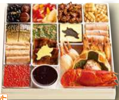
TEL ネット 111 214-0111 【金沢・ぶどうの木】 オードブル・クオリテ…(本体価格16,000円)税込 17,280円 サイズ(29.0×29.0×高さ5.0cm×一段)