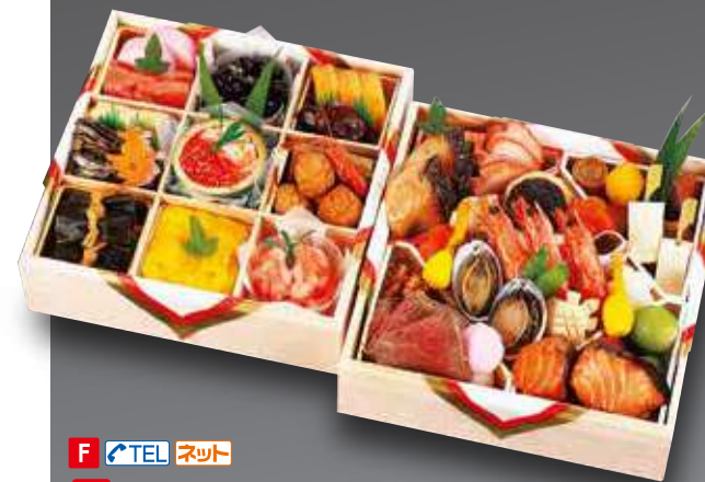
F TEL ネット 41 214-0041 【京都・濱登久】 和風二段…(本体価格15,000円)税込 16,200円 サイズ(21.5×21.5×高さ6.2cm×二段)

京都 京料理 岡庄 おかしょう 創業百三十余年の伝統をいかし、料理人が腕によりをかけて作った逸品おせち。