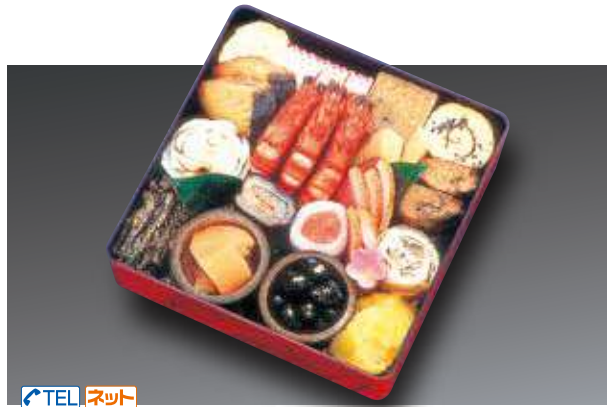
122 214-0122 【堀川御池・二傳】 和風一段…(本体価格12,000円)税込 12,960円 サイズ(19.5×19.5×高さ5.0cm×一段)