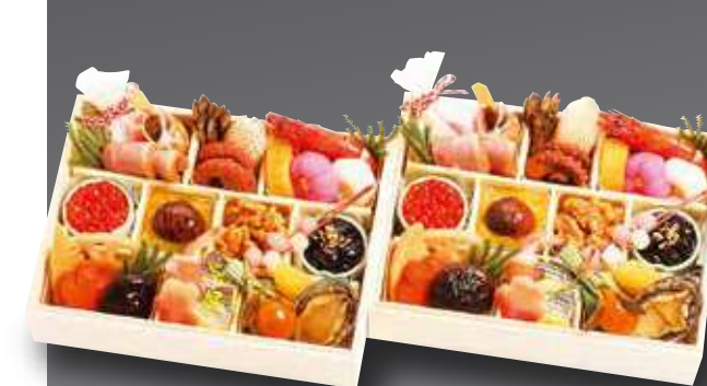
F TEL ネット 155 214-0155 【京都・三千院の里】 送料込 和風個食二折…(本体価格11,000円)税込 11,880円 サイズ(15.7×20.8×高さ4.6cm×二客)