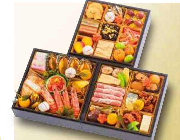
TEL ネット 102 214-0102 【東京・なすび亭】 和風三段…(本体価格25,000円)税込 27,000円 サイズ(17.5×17.5×高さ4.9cm×三段)