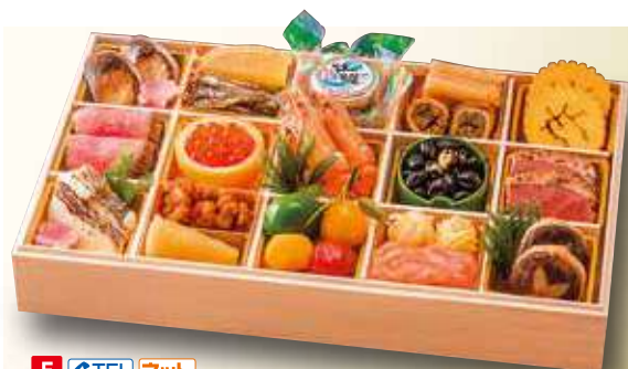
F TEL ネット 95 214-0095 【福山・鞆の浦 ホテル鷗風亭】 和洋一段…(本体価格10,000円)税込 10,800円 サイズ(21.2×34.6×高さ4.0cm×一段)