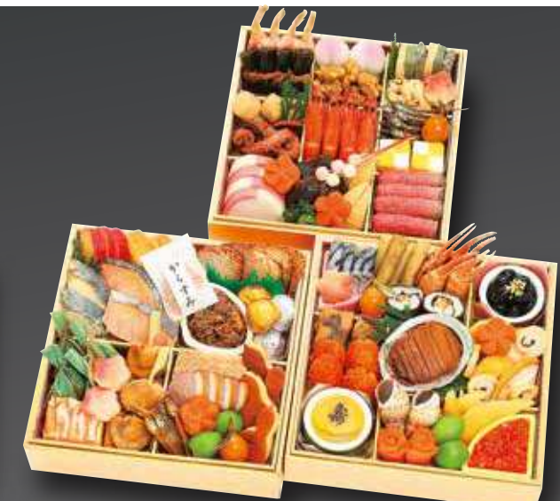
F TEL ネット 送料込 152 214-0152 【京都・三千院の里】 和風三段…(本体価格25,000円)税込 27,000円 サイズ(21.6×21.6×高さ5.4cm×三段)