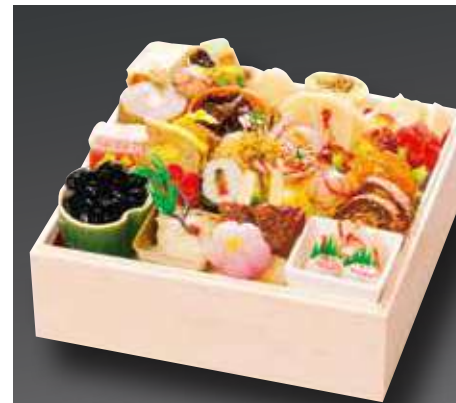
F TEL ネット 38 214-0038 【京都・泉仙】 精進おせち一段…(本体価格15,000円)税込 16,200円 サイズ(21.2×21.2×高さ6.6cm×一段)

京都 宇治 辰巳屋 たつみや 茶所宇治にふさわしい、抹茶の風味と旬の食材を活かした「抹茶料理」が評判の名店から。