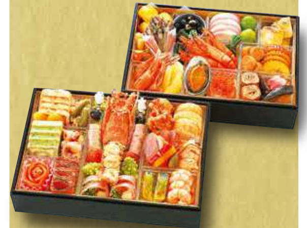
F TEL ネット 85 214-0085 【大阪・リーガロイヤルホテル】 和洋二段…(本体価格35,000円)税込 37,800円 サイズ(20.5×29.7×高さ6.5cm×二段)