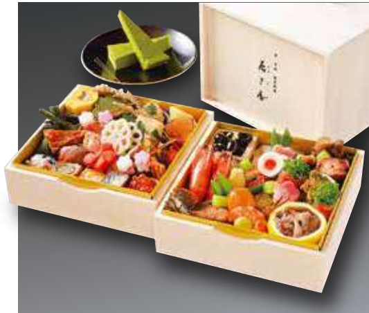
TEL ネット 42 214-0042 【京都・辰巳屋】 和風二段…(本体価格30,000円)税込 32,400円 サイズ(16.5×16.5×高さ5.0cm×二段、自家製抹茶チーズケーキ付)

京都 貴船 右源太 うげんた 京の奥座敷、貴船にある料理旅館。 素材の持ち味を活かした山海の幸をお楽しみください。