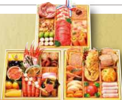
F TEL ネット 112 214-0112 【キャピタル東洋亭本店】 京乃百年洋食 和洋三段…(本体価格32,500円) 税込 35,100円 サイズ(22.7×22.7×高さ5.2cm×三段)