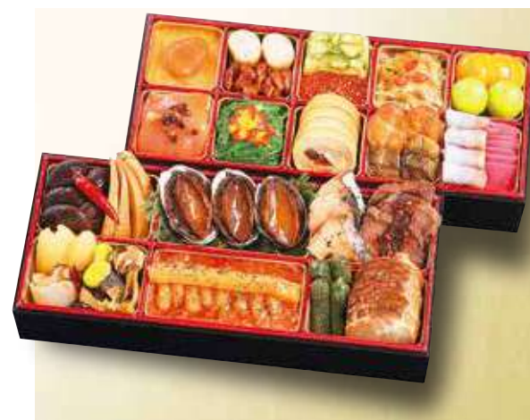
TEL ネット 103 214-0103 【東京・中国料理 美虎】 中華二段…(本体価格25,000円)税込 27,000円 サイズ(12.8×30.0×高さ5.4cm×二段)