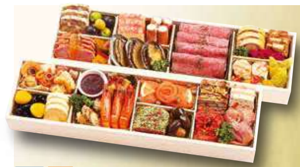
TEL ネット 109 214-0109 【東京・シェ松尾】 洋風(フレンチ)二段…(本体価格28,000円)税込 30,240円 サイズ(11.1×41.5×高さ5.3cm×二段)