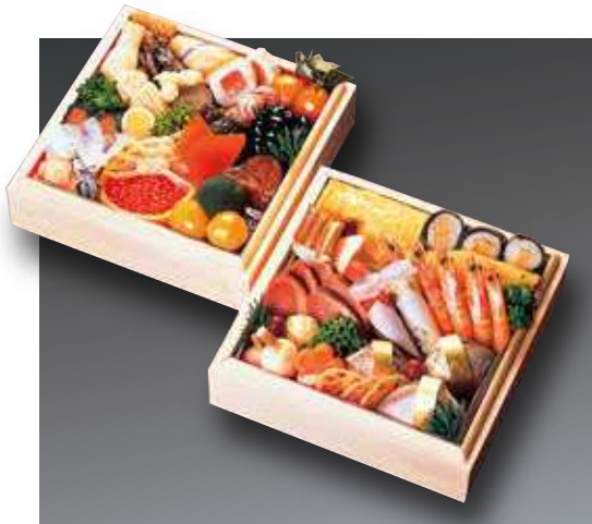
TEL ネット 45 214-0045 【京都・光流園 静山荘】 和風二段…(本体価格35,000円)税込 37,800円 サイズ(21.0×21.0×高さ6.0cm×二段)

京都 泉仙 いづせん 京野菜を中心に厳選素材の持ち味を伝承の技で生かした彩りのおせちです。