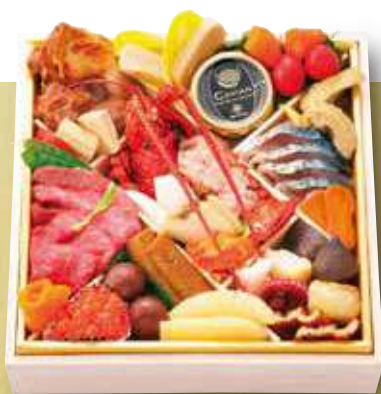
TEL ネット 106 214-0106 【大阪・エプバンタイユ】 シェフの渾身フレンチ一段重…(本体価格50,000円)税込 54,000円 サイズ(20.2×20.2×高さ5.0cm×一段)