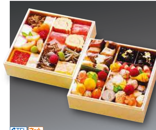
TEL ネット 43 214-0043 【京都・貴船 右源太】 気生根(きふね)お節 和風二段 …(本体価格30,000円)税込 32,400円 サイズ(19.4×19.4×高さ5.5cm×二段)

京都 貴船 右源太 うげんた 京の奥座敷、貴船にある料理旅館。 素材の持ち味を活かした山海の幸をお楽しみください。