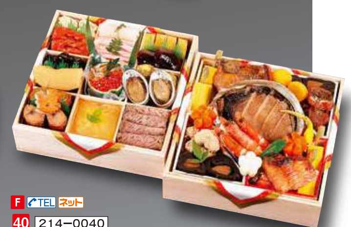
F TEL ネット 40 214-0040 【京都・濱登久】 和風二段…(本体価格27,500円)税込 29,700円 サイズ(21.5×21.5×高さ6.2cm×二段)

京都 濱登久 はまどく 雅な京の味を心ゆくまで楽しめる、料亭のこだわりを詰合せました。