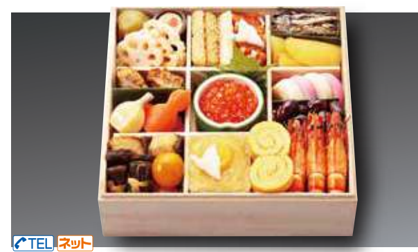
117 214-0117 【栗田口・美濃吉】 和風一段…(本体価格13,000円)税込 14,040円 サイズ(21.9×21.9×高さ5.7cm×一段)