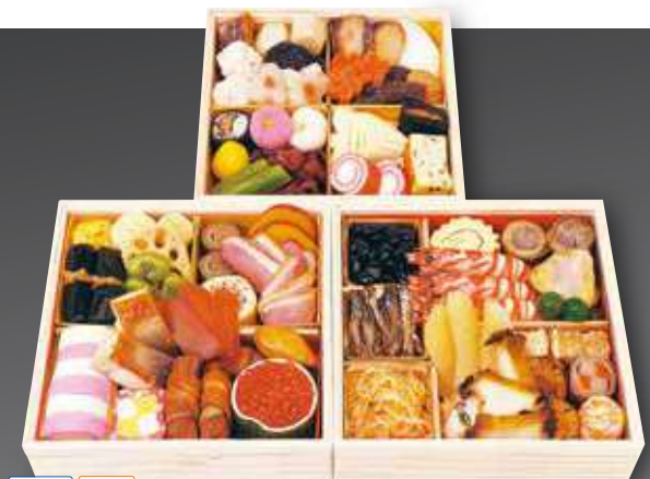
TEL ネット 46 214-0046 【京都・岡庄】 和風三段…(本体価格25,000円)税込 27,000円 サイズ(20.0×20.0×高さ6.0cm×三段)

京都 京料理 岡庄 おかしょう 創業百三十余年の伝統をいかし、料理人が腕によりをかけて作った逸品おせち。