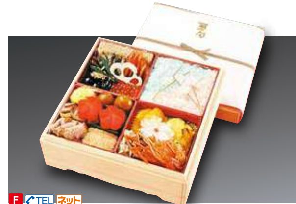
115 214-0115 【河原町・たん熊北店】 和風一段…(本体価格15,000円)税込 16,200円 サイズ(20.7×20.7×高さ6.7cm×一段)