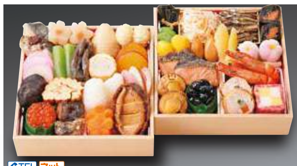
127 214-0127 【唐橋・岡庄】 和風二段…(本体価格10,000円)税込 10,800円 サイズ(19.5×19.5×高さ5.2cm×二段)