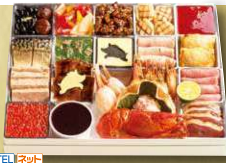
TEL ネット 110 214-0110 【金沢・ぶどうの木】 オードブル・ビアンコ…(本体価格18,000円)税込 19,440円 サイズ(29.0×36.0×高さ5.0cm×一段)