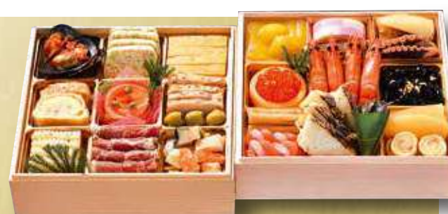
F TEL ネット 94 214-0094 【福山・鞆の浦 ホテル鷗風亭】 和洋二段…(本体価格21,296円)税込 23,000円 サイズ(20.0×20.0×高さ5.0cm×二段)