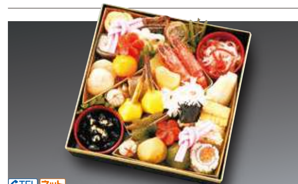
121 214-0121 【洛西・矢尾卯】 和風一段めおと重…(本体価格12,000円)税込 12,960円 サイズ(19.5×19.5×高さ6.0cm×一段)