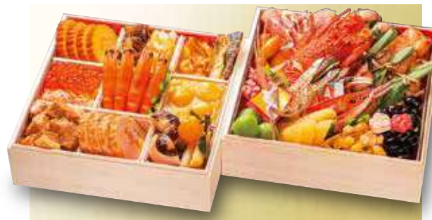
F TEL ネット 91 214-0091 【シェラトングランドホテル広島】 和洋二段…(本体価格20,000円)税込 21,600円 サイズ(21.5×21.5×高さ5.7cm×二段)