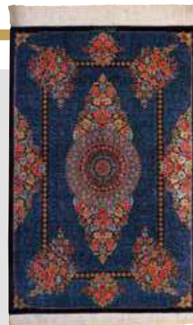
ペルシャ絨毯クム産 (シャイエステ工房) 組成/絹100% サイズ/約79×119cm 特別価格 税込 1,100,000円 #1760