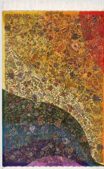
ペルシャ絨毯クム産 (ゴシャエシュ工房) 組成/絹100% サイズ/約98×148cm 特別価格 税込 3,960,000円 #6600

新進気鋭の作家たちの独創的な作品。斬新なデザインと独特の色使いが素晴らしく、近年力をつけてきている次世代工房。