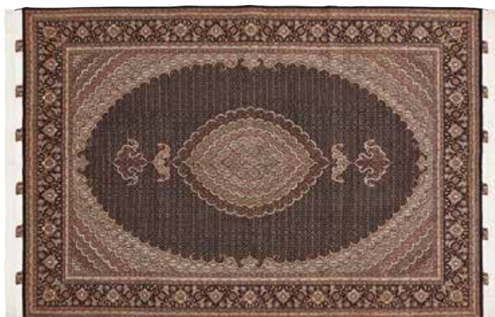
ペルシャ絨毯タブリーズ産 組成／毛100% サイズ／約202×295cm 特別価格 税込 1,980,000円 #3520