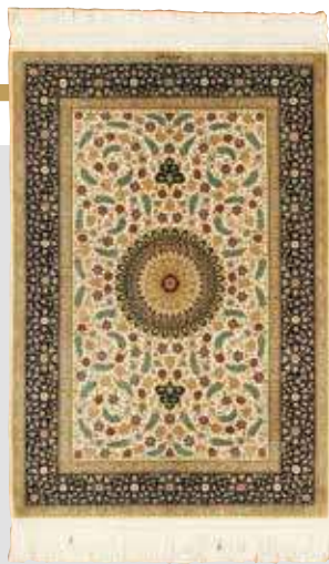
ペルシャ絨毯クム産 (アルサラニ工房) 組成/絹100% サイズ/約74×109cm 特別価格 税込 1,320,000円 #3300