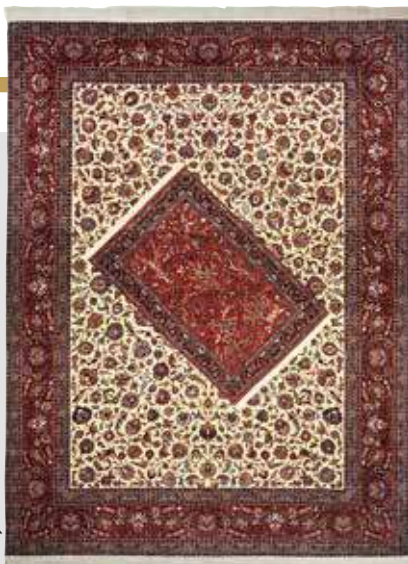
ペルシャ絨毯タブリーズ産 (ICC工房) 組成/毛100% サイズ/約306×406cm 税込 20,900,000円

そしてこの絨毯は、中心のカーペットが平行ではなく斜めに描かれており、柄の継ぎ目や全体のバランスを保つのが非常に難しい文様となっているため、高度の技術が必要となります。ICCの洗練された職人が、あたかも普通の作品のように仕上げているところに更なる稀少価値が生まれています。