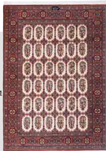
ペルシャ絨毯テヘラン産 (ICC工房) 組成/毛100% サイズ/約148×207cm 税込 10,450,000円

ICCが1953年に制作したナスレディング文様のオリジナルデザインの作品。パーレビ国王2世の妻 ファラ王妃が60年代後半にICCを訪問した際、このデザインを気に入り、新たに別注で製作を依頼した逸話を持つ品です。