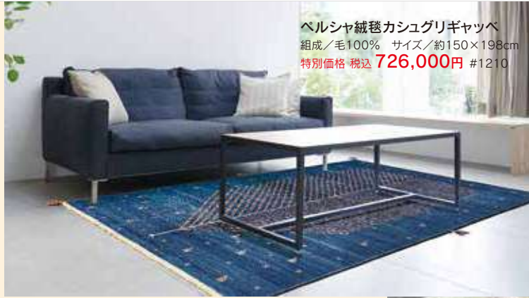
ペルシャ絨毯カシュグリギャッベ 組成/毛100% サイズ/約150×198cm 特別価格 税込 726,000円 #1210