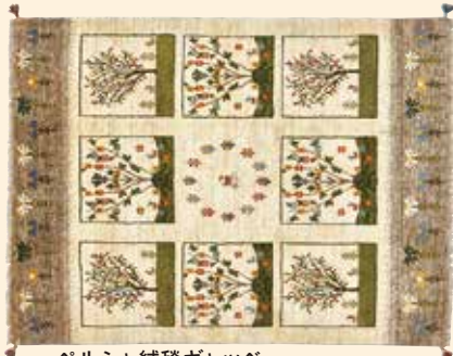
ペルシャ絨毯ギャッベ 組成/毛100% サイズ/約155×207cm 特別価格 税込 275,000円 #453