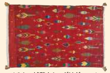
ペルシャ絨毯カシュグリギャッベ 組成/毛100% サイズ/約80×125cm 特別価格 税込 220,000円 #399