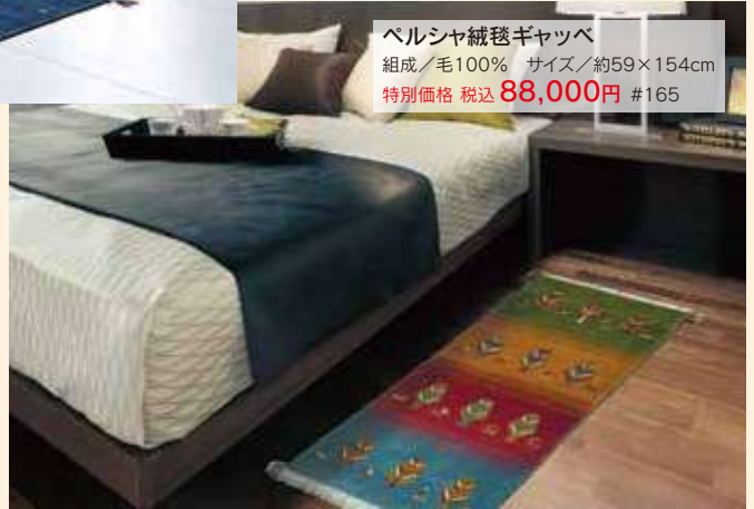
ペルシャ絨毯ギャッベ 組成/毛100% サイズ/約59×154cm 特別価格 税込 88,000円 #165