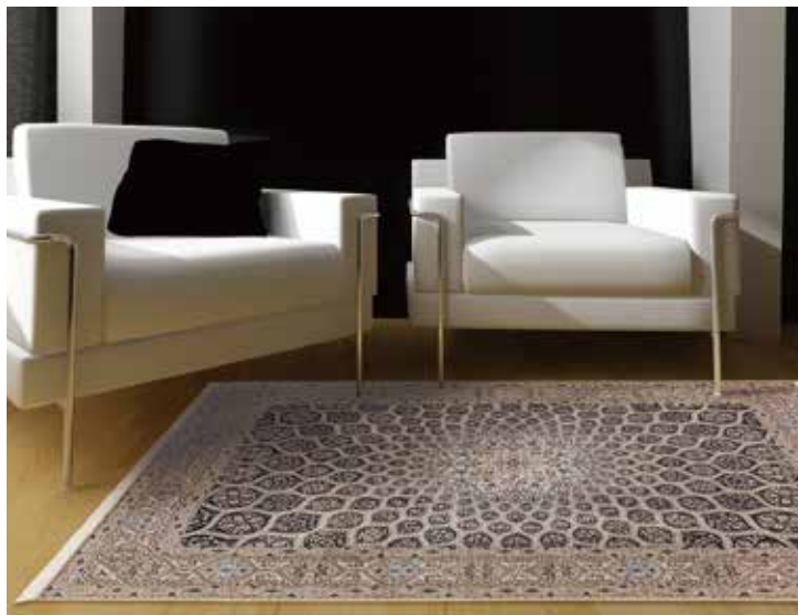
ペルシャ絨毯ナイン産 組成／毛100% サイズ／約177×258cm 特別価格 税込 1,815,000円 #3025