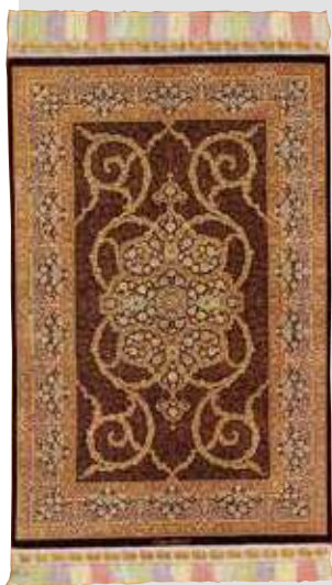
ペルシャ絨毯クム産 (ジェットイ工房) 組成/絹100% サイズ/約100×151cm 特別価格 税込 4,950,000円 #8250

高度な技を持つ匠たち。次の世代に繋げる作品を創り続ける有名工房、世界に一つしかない手織の逸品。