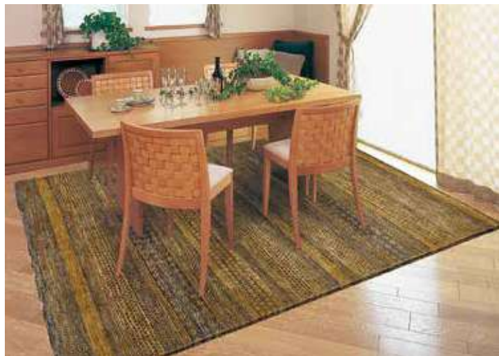
パキスタン製手織絨毯 組成／毛100% サイズ／約200×250cm 特別価格 税込 330,000円 #550