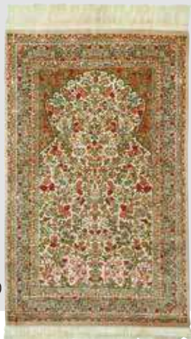
ペルシャ絨毯クム産 (ラジャビアン工房) 組成/絹100% サイズ/約78×119cm 特別価格 税込 3,300,000円 #5500