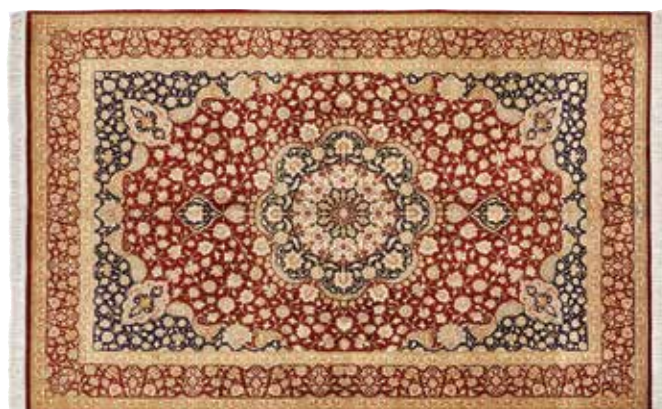
ペルシャ絨毯クム産 組成／絹100% サイズ／約129×200cm 特別価格 税込 1,452,000円 #3300