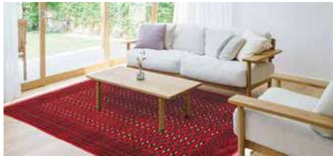
ペルシャ絨毯トルクメン産 組成/毛100% サイズ/約130×194cm 特別価格 税込 253,800円 #423