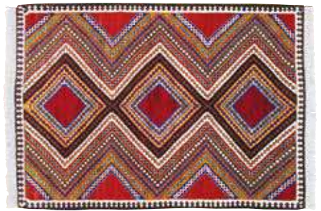
ペルシャ絨毯カシュガイ産 組成/毛100% サイズ/約105×146cm 特別価格 税込 396,000円 #660