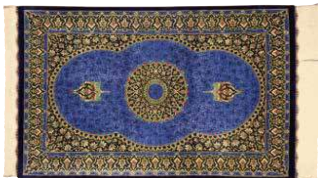
ペルシャ絨毯クム産 組成／絹100% サイズ／約59×90cm 特別価格 税込 726,000円 #1210

玄関、リビング、ダイニングに、手織り絨毯は使うほどにその良さがわかります。時を経ても変わらない伝統柄のペルシャ絨毯はお部屋を彩るにふさわしい一枚となります。また、ウールの手織り絨毯は丈夫さや温もりを備え、機能性においてもすぐれています。