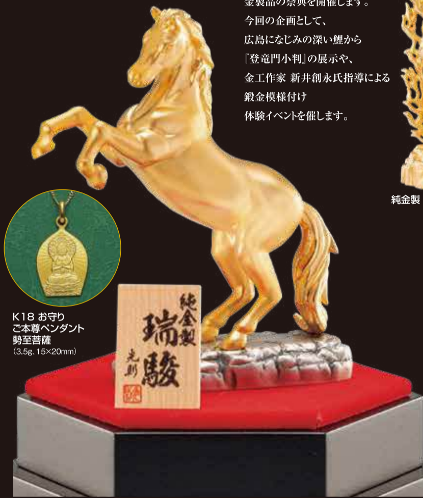
K18 お守りご本尊ペンダント 勢至菩薩(3.5g、15×20mm)