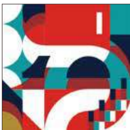
●「Puzzle #003」 (アクリル+金箔+キャンバス、85.0×85.0cm)