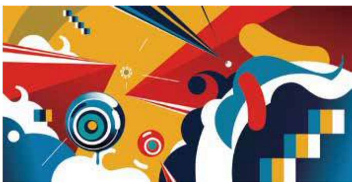
●「EXECUTION」(アクリル+金箔+キャンバス、98.0×195.0cm)