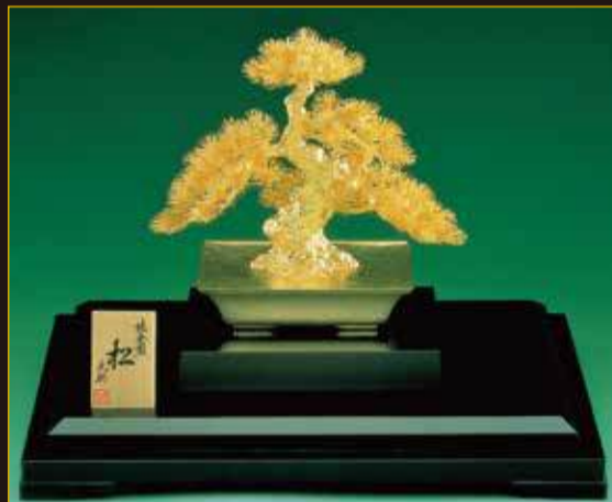
純金製 盆栽 松 5号(250g、290×220×260mm)