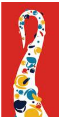
●「MOVEMENT —うねりのかたち—」 (アクリル+金箔+キャンバス、142.2×71.1cm)