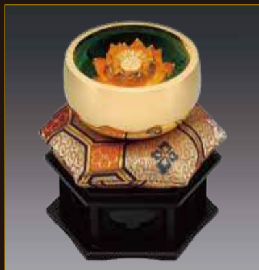
K18 御尊(3.0寸+純金製蓮飾り2.0寸)