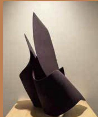
●森山 寛二郎「伸」 (陶磁器、H86.0×W60.0×D55.0cm)