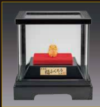
純金製 福ふくろう(3g、120×110×120mm)