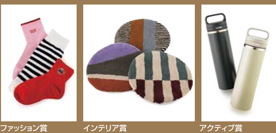
ファッション賞 インテリア賞 アクティブ賞