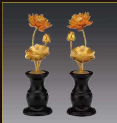
純金製 蓮常花揃 3本立(80g、150mm)