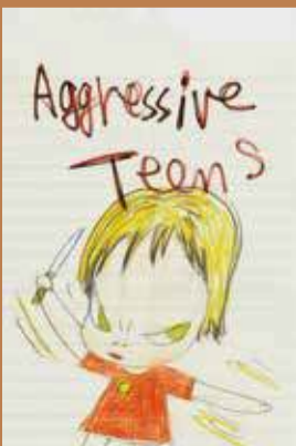
●奈良 美智「Untitled」 (色鉛筆+ペン+紙、23.0×15.0cm)