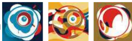
●「SPEAKER Series」 (アクリル+金箔+キャンバス、各45.4×45.4cm)